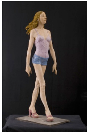
Marco Cornini Con quella sua camminata sicura scultura in terracotta 106 x 46 x 30 cm