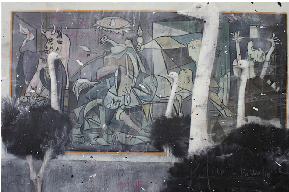
Angelo Accardi Misplaced olio su tela 100 x 150 cm